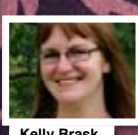
Kelly Brask - kamrer -